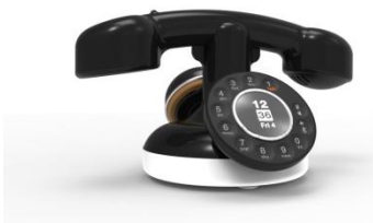
Le téléphone NeoRetro par Orange

Depuis sa constitution, le patrimoine et en particulier la Collection Historique d'Orange ont été maintes fois sollicités pour défendre les intérêts de l'entreprise. La plupart du temps, il s'agissait d'actions en justice menées, à son encontre, principalement sur des brevets déposés. Grâce à nos fonds documentaires et historiques nos adversaires ont été déboutés.